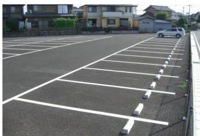
開粒アスファルト