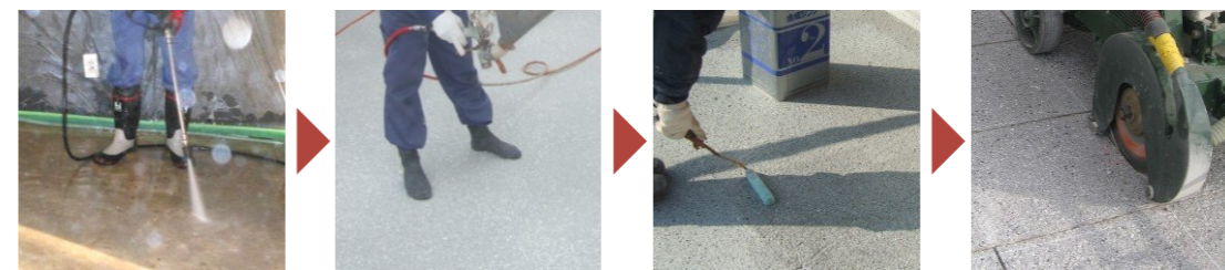
洗淨・プライマー塗布 洗淨した床面に専用プライマーを塗布します ※施工面がコンクリートの場合のみ