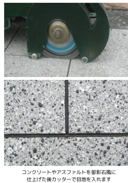
コンクリートやアスファルトを御影石風に仕上げた後カッターで目地を入れます

SREM series Special Resinoid Mortar Askit